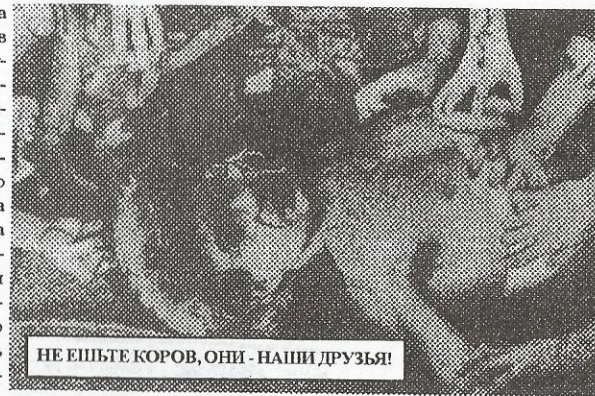
НЕ ЕШЬТЕ КОРОВ, ОНИ - НАШИ ДРУЗЬЯ!

в октябре 2003 г. сейчас команда в поте лица репетирует, чтобы в скором времени выпустить дебютный альбом под рабочим названием "Самоповешение, самоожжение, самопоедание, самоубийство с помощью засовывания карандаша в нос и удара головой о стол и пр.", также с весны ребята начнут свою деятельность на клубных аренах Питера. Как и кефир, "кифир-метал" надеется стать лекарством от сильной пост-алкогольной интоксикации. Зато на счёт заворота кишок обещать что-либо администрация отказывается.